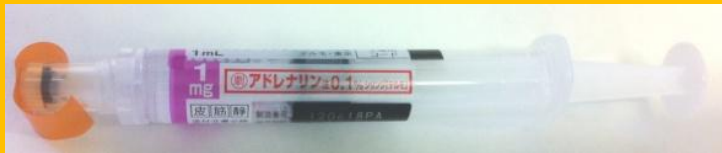
アドレナリン注 0.1%シリンジ

筋肉内注射後15分たっても改善しない場合、また途中で悪化する場合は追加投与を考慮する。